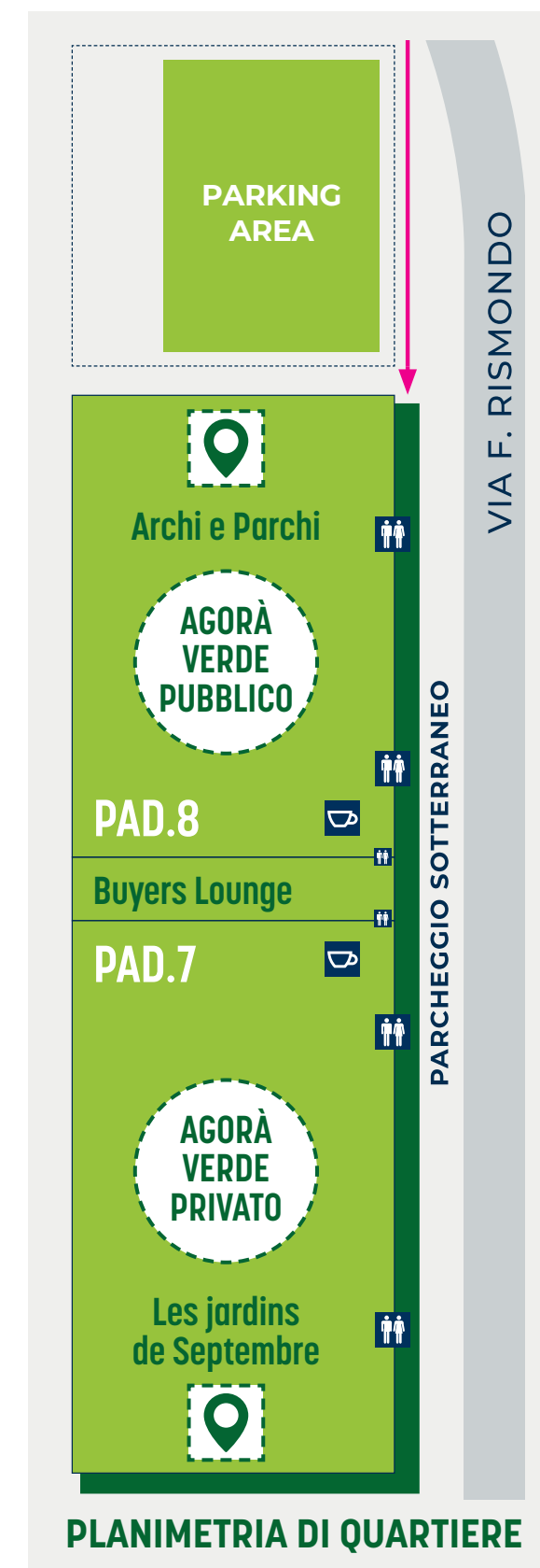
PLANIMETRIA DI QUARTIERE