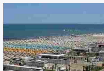
Balneari, Rustignoli (Fiba): "Nessun allarme da sentenza, accelerare su mappatura coste"