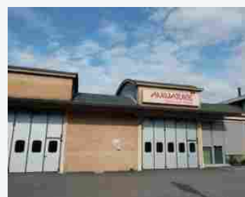
Aninature, cercasi nuovi incaricati alla vendita diretta nel settore pet food