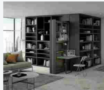
Il marchio Protek scommette sulla ripresa sostenibile e a zero emissioni

Flormart - The Green Italy è organizzata dal gruppo Fiere di Parma , che già dalla scorsa