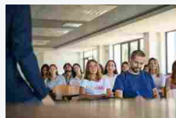
Click days Unicusano, 180 borse di studio