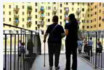
Welfare aziendale, ecco 5 macro tendenze del 2023