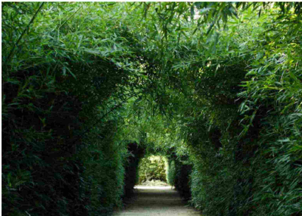
Corridoio del Labirinto di bambù. Labirinto della Masone, Fontanellato (Parma)