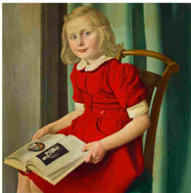
Bambina che legge, 1938. Fondazione Cavallini-Sgarbi, Ferrara